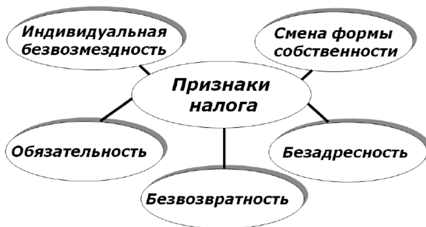
Рис. 1. Признаки налога

Признаки налога представлены на рисунке 1.