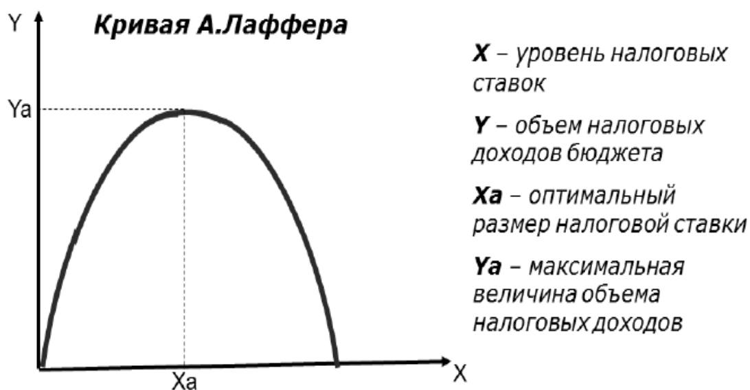
Рис. 2. Кривая Лаффера

Исследуя связь между величиной налоговой ставки и поступлением налогов в бюджет, американский экономист Артур Лаффер показал, что повышение налогов может привести к снижению поступлений в бюджет. Смысл кривой в том, что снижение предельных ставок и вообще налогов обладает мощным стимулом воздействия на производство. При сокращении ставок база налогообложения в конечном счете увеличивается (выпускается больше продукции, доходы людей растут, растут налоги) (рисунок 2).